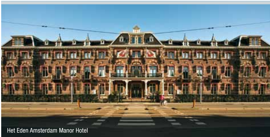
Het Eden Amsterdam Manor Hotel