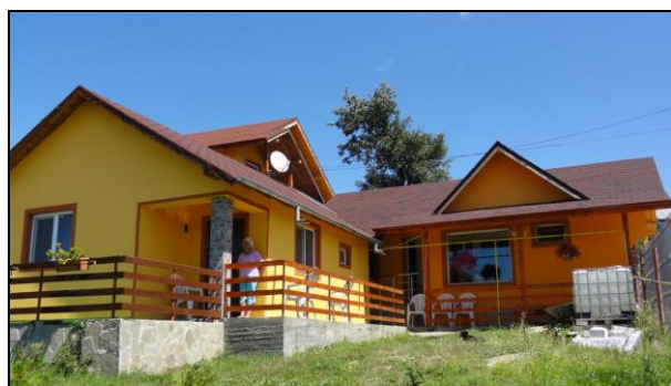
Nieuwe situatie (juli 2011)