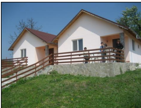
Oude situatie (april 2010)