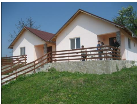
De twee bestaande huisjes in april 2010