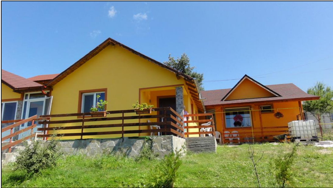
Het resultaat: een prachtig gebouw waar ouderen en jongeren samen kunnen wonen