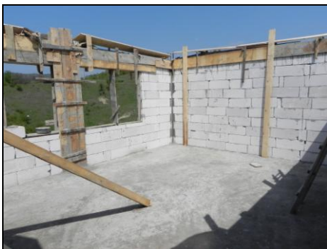
Hier komt de eetzaal